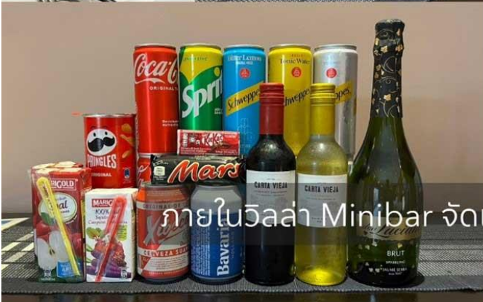
ภายในวิลล่า Minibar จัดเต็ม พร้อมชุดต้อนรับ