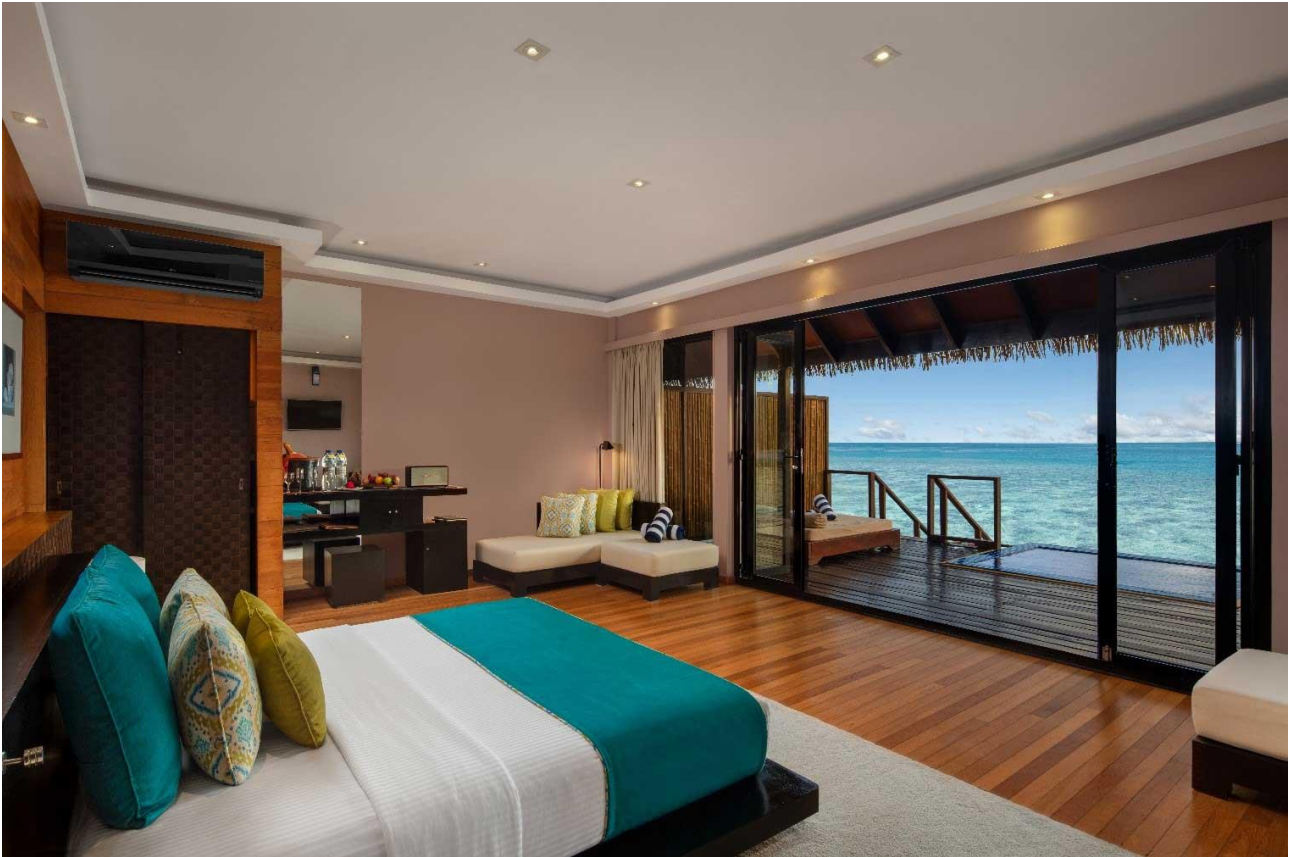
มี Jacuzzi อยู่ด้านหลังของวิลล่า