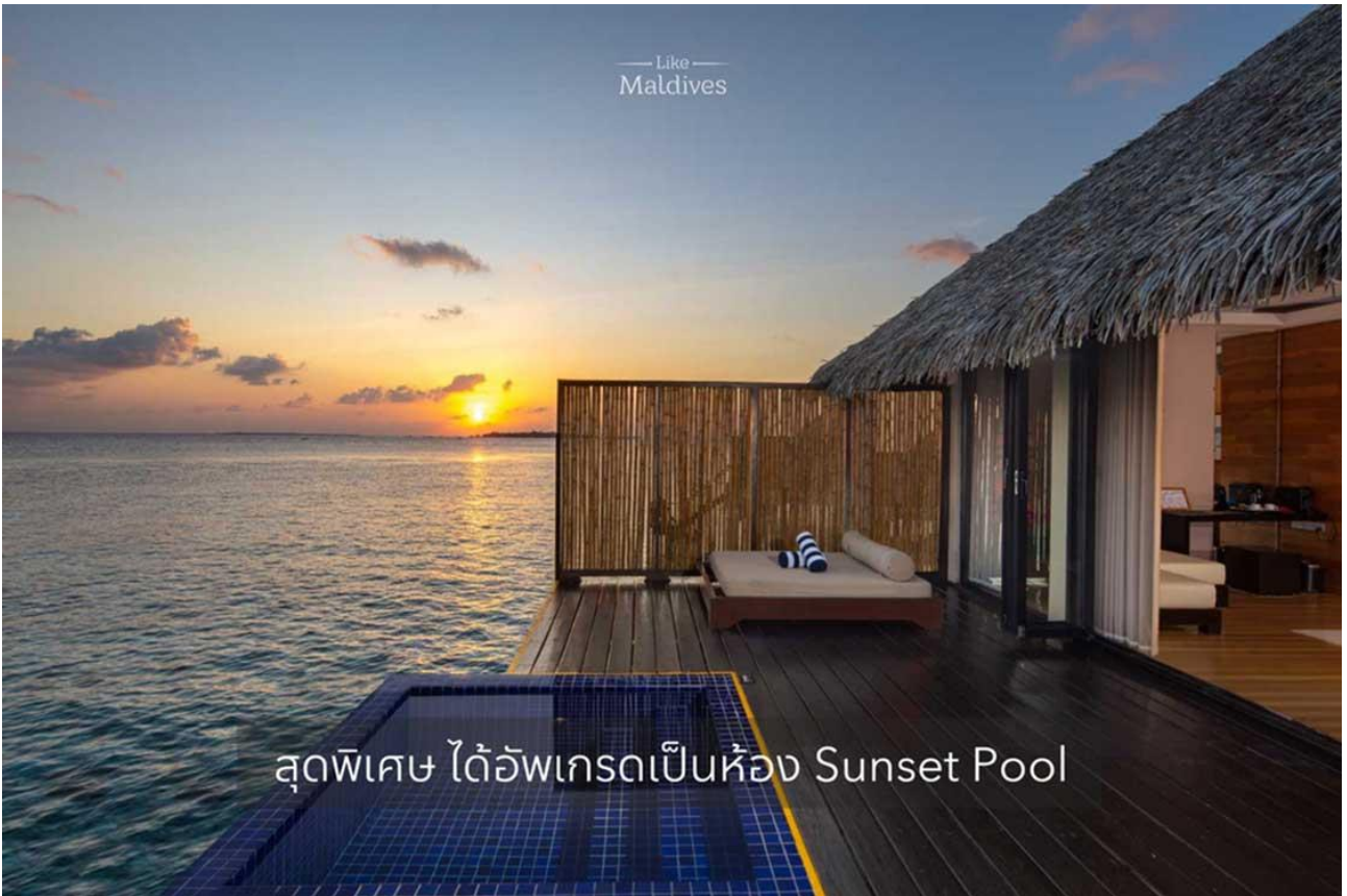
สุดพิเศษ ได้อัพเกรดเป็นห้อง Sunset Pool