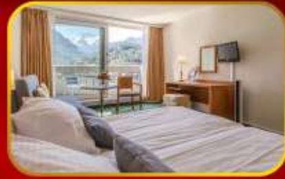
พีเร็วค 10-18 พ.ย. 67 พักโรงแรม Hotel Metropole Interlaken โรงแรมใจกลางเมืองแห่งขุนเขา 2 คืนคิด

ไม่ต้องจ่ายเพิ่ม ไม่ต้องรอลุ้น การันตีชัวร์ๆ