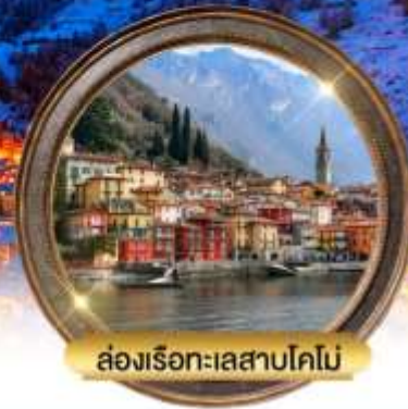
ล่องเรือทะเลสาบโคโม