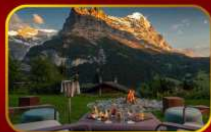
พีเร็วค 21-29 ต.ค. 67 พักโรงแรม Sunstar Alpine Hotel Grindelwald วิวอลังการแสนล้าน 2 คืนคิด!!