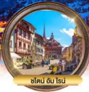
ชิลอน อิม โรน