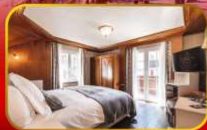
Exclusive การันตีพัก Boutique Hotel Albana Real Zermatt ทั้ง 2 ปีเร็ว