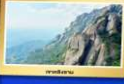
เขาตีสถาน