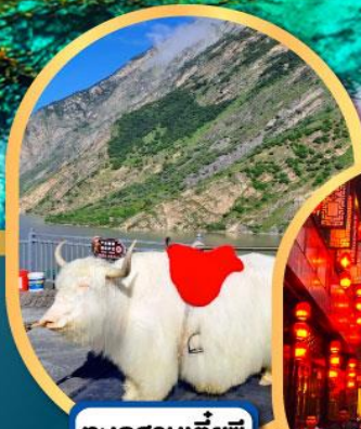
ทะเลสาบเตี้ยซี