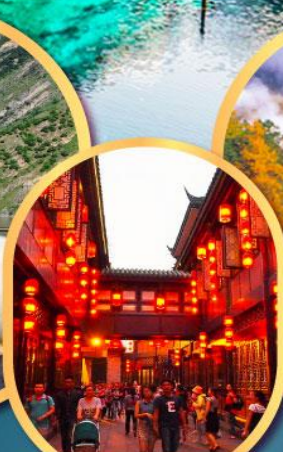
ถนนโบราณจีนหฺลี่