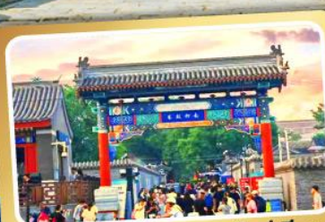
ถนนโบราณหนานหลิวกู่เซียง