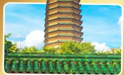
วัดพระเจี๋ยวแก้ว

เมนูพิเศษ เปิดปักกิ่ง, ชาหมูหม้อไฟ อาหารกวางตุ้ง, อาหารเสฉวน