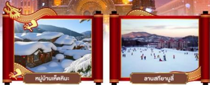
หมู่บ้านหิมะหิมะ

• มหัทศจรรย์คืบแดนฤดูหนาว หมู่บ้านหิมะแห่งความฝัน