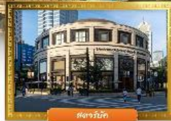
เดอะบับเบิล

☑️ ซื้อบิง POP MART ถ่ายรูปคู่กันคิมอิกซ์