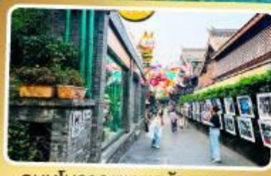
ถนนโบราณชอยกวางชอยแคบ