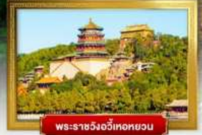
พระราชวังอวิเทอหยวน