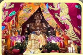
• เอียงบู๊ซัว (ศาลเจ้าพ่อเสือ)