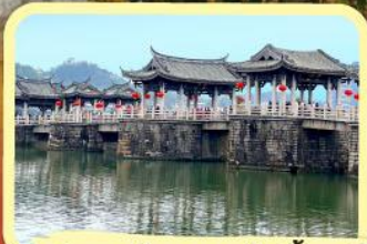
• สะพานโบราณกว้างจี