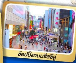
ช้อปปิ้งถนนซิลลี่