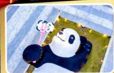
หมีแพนด้าออนเซล์ฟี่