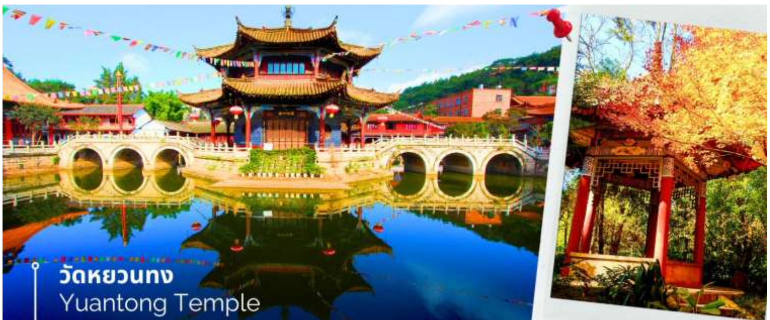
วัดหยวนทง Yuantong Temple

นำท่านชม วัดหยวนทง (Yuantong Temple) วัดแห่งนี้เป็นวัดที่ใหญ่และเก่าแก่ที่สุดในเมืองคุนหมิง สร้างมาตั้งแต่สมัยราชวงศ์ถัง มีอายุยาวนานประมาณ 1,200 กว่าปี การสร้างวัดแห่งนี้จะแปลกตากว่าวัดอื่นในจีน เพราะปกติแล้วการสร้างวัดของจีนส่วนมากจะต้องสร้างอยู่บนภูเขา แต่วัดหยวนทงสร้างวัดต่ำกว่าภูเขา โดยวิหารจะอยู่ต่ำที่สุด เนื่องจากวัดแห่งนี้ไม่ได้สร้างขึ้นเพื่อเป็นวัดโดยตรง แต่เคยเป็นศาลเจ้าแม่กวนอิมมาก่อน