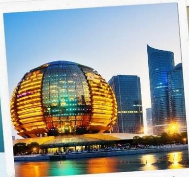
HANGZHOU CITY BALCONY