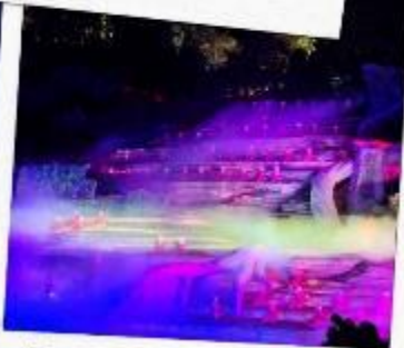
โชว์นางจิ้งจอกขาว