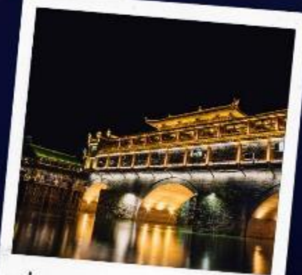
ล่องเรือแม่น้ำถั่วเจียง