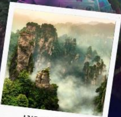
เขาวงตาร