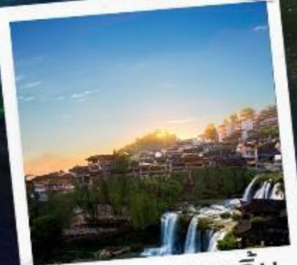
เมืองฟูหลงเจิน