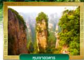
หินเงาอวดสาร