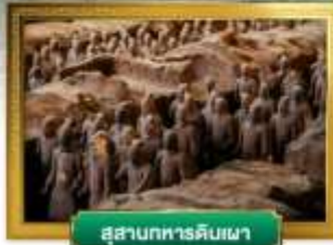
สุสานทหารดินเผา