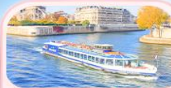
คลองเรือแม่น้ำแซน