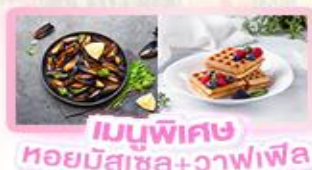
เมนูพิเศษ หอยมัสเซล+วาฟเฟิล