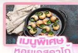
เมนูพิเศษ หอยออสตาโก้

เยอรมัน เนเธอร์แลนด์ เบลเยียม ฝรั่งเศส Keukenhof