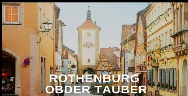
ROTHENBURG OBDER TAUBER