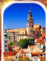
CESKY KRUMLOV CZECH