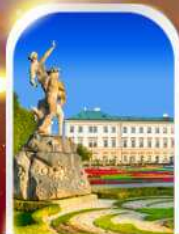
MIRABELL PALACE AUSTRIA