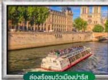
ล่องเรือชมวิวเมืองปารีส