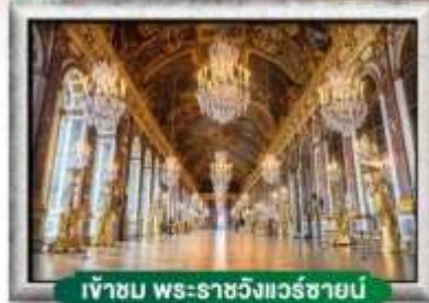
เข้าชม พระราชวังแวร์ซายน์