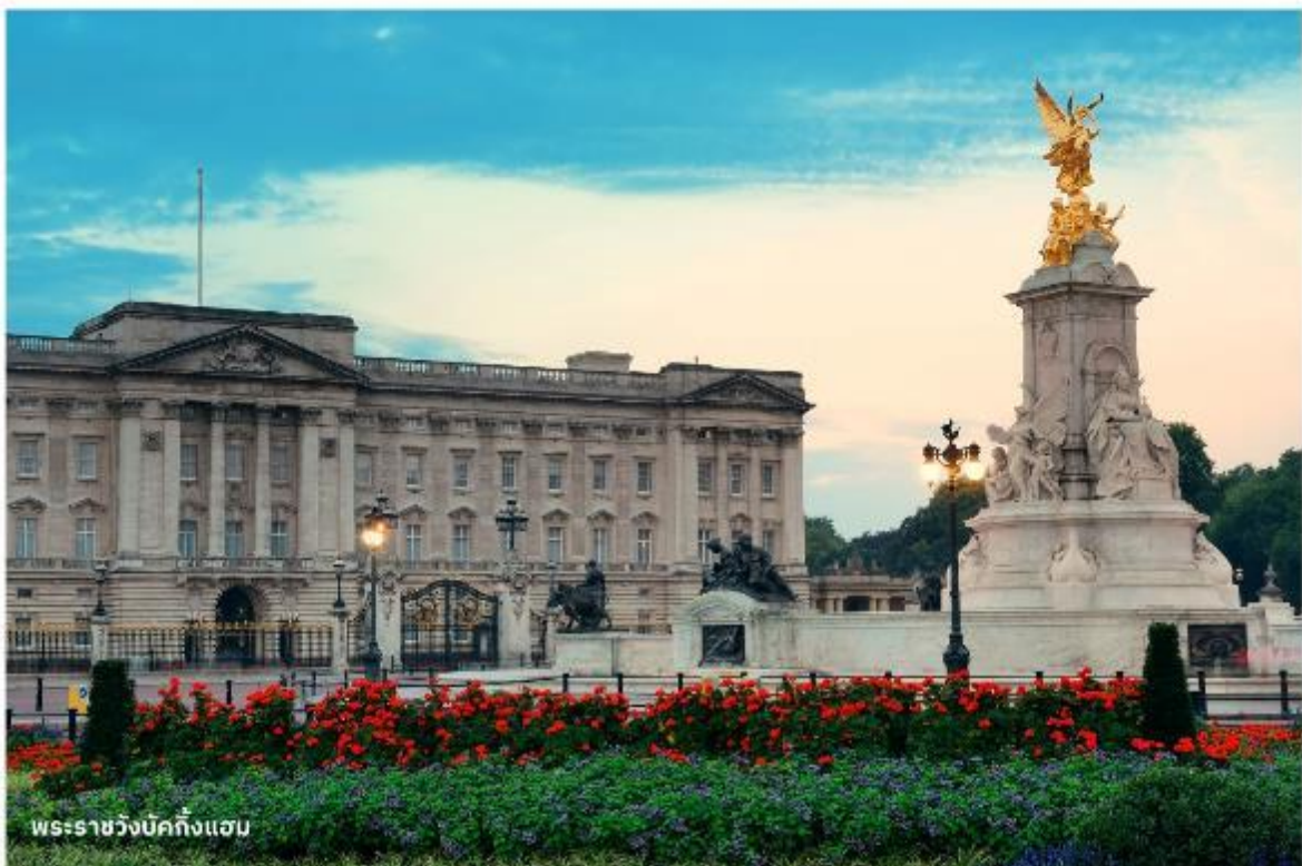
พระราชวังบักกิงแฮม