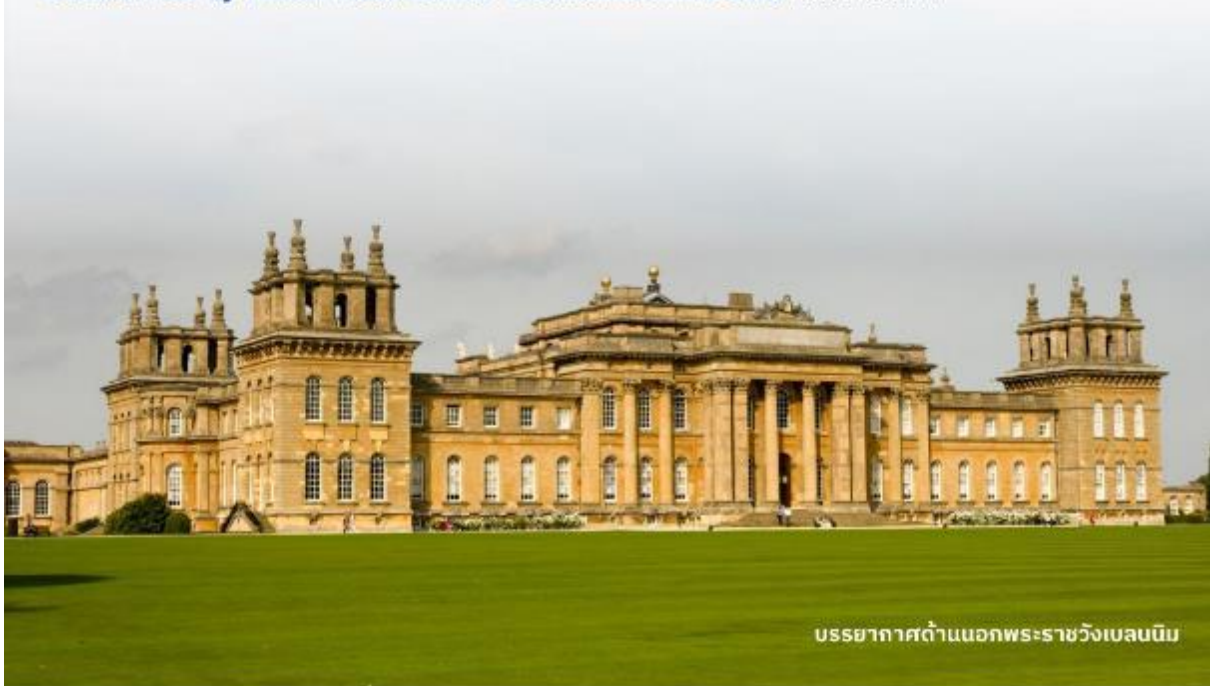
บรรยากาศด้านนอกพระราชวังเบลนนิม

บริการอาหารค่ำ ณ ภัตตาคาร นำท่านเข้าสู่ที่พัก DoubleTree by Hilton Hotel Londo -Docklands Riverside หรือเทียบเท่า