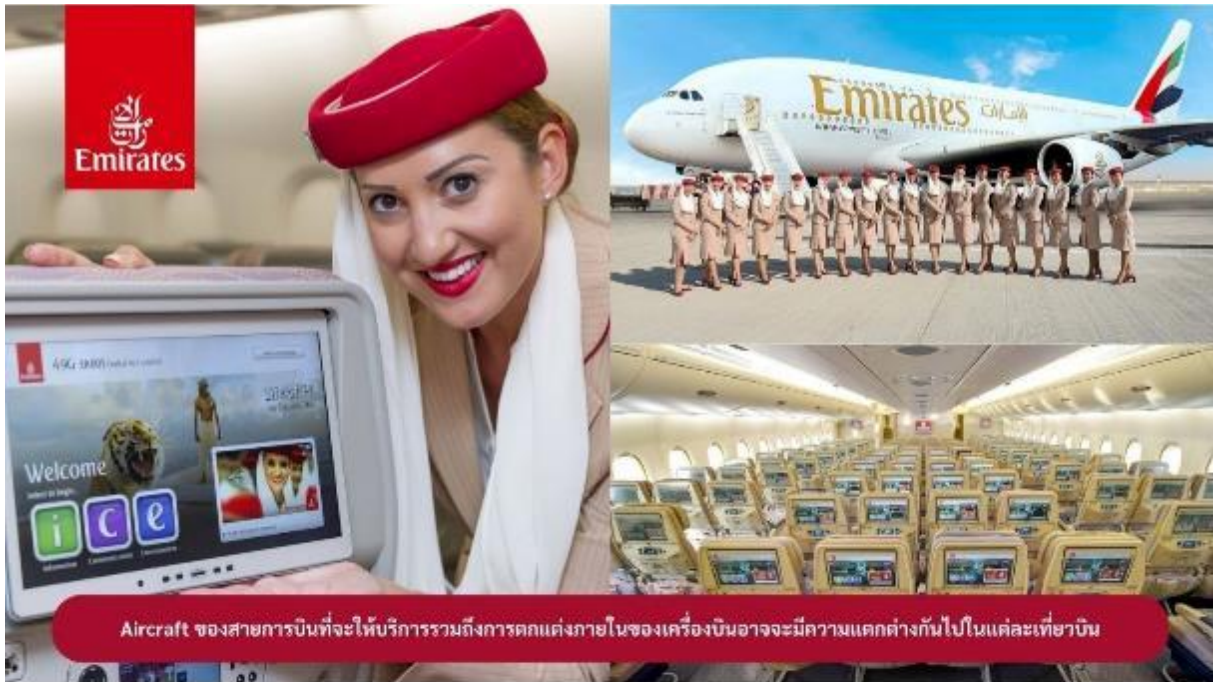
Aircraft ของสายการบินที่จะให้บริการรวมถึงการตกแต่งภายในของเครื่องบินอาจจะมีคามแตกต่างกันไปในแต่ละเที่ยวบิน