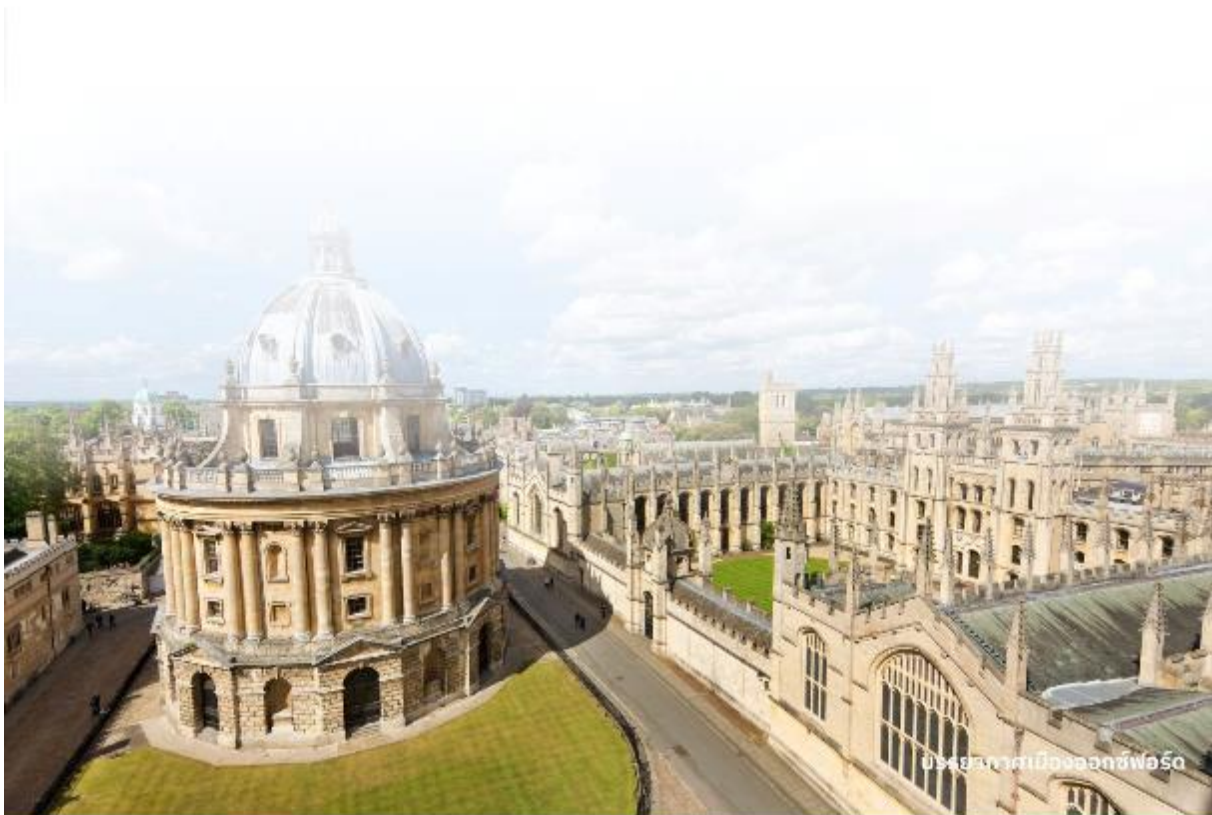
บรรยากาศเมืองออกซ์ฟอร์ด

จากนั้นนำท่านเดินทางไปยัง พระราชวังเบลนนิม ในมณฑลออกฟอร์ดเชียร์ ที่นี่เป็นที่เกิดของ เซอร์วินสตัน เชอร์ชิลล์ ผู้นำอังกฤษในสมัยสงครามโลกครั้งที่ 2 และเป็นพระราชวังสโตนบารอกที่งดงามที่สุดในอังกฤษ Blenheim Palace นั้นเป็นวังเดียวในอังกฤษที่เจ้าของไม่ได้เป็นเชื้อพระวงศ์ แต่วังแห่งนี้เป็นที่พำนักอาศัยหลักของ Dukes of Marlborough และภายหลังได้รับการยกย่องเป็น World Heritage Site โดย UNESCO ในปี ค.ศ. 1987 อิสระให้ท่านถ่ายภาพพระราชวังจากด้านนอกตามอัธยาศัย