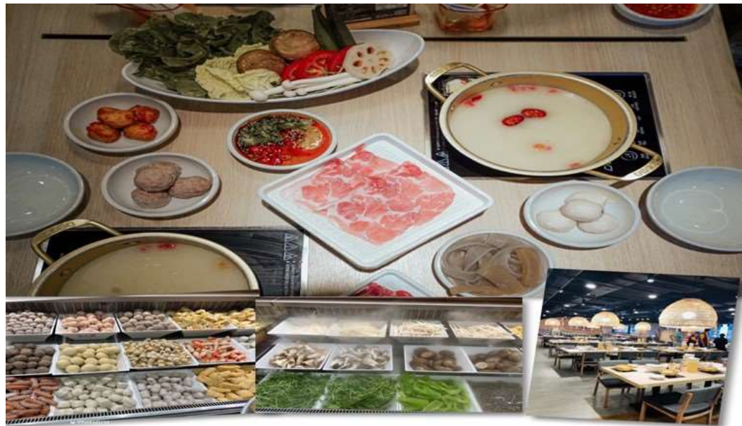
เที่ยง รับประทานอาหารเที่ยง ณ ภัตตาคาร (5) เมนูชาบู