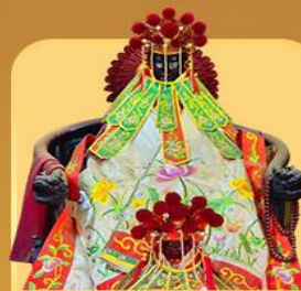
เจ้าแม่กวนอิมสองขำ