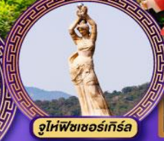
จูโห่พิพิธภัณฑ์