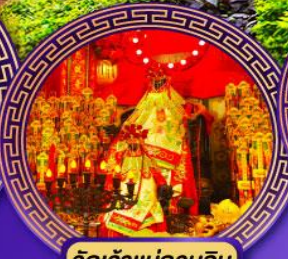
วัดเจ้าแม่กวนอิม ฮ่องฮ่า