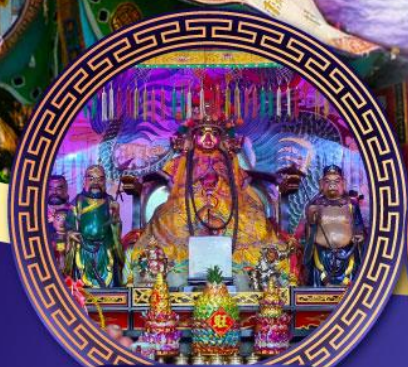
ศาลเจ้าหังเจีย