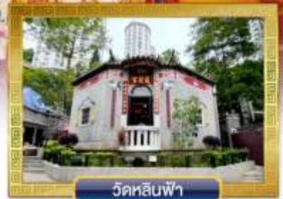
วัดหลินฟ้า