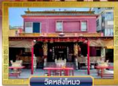
วัดหลังใหม่