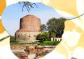
कुสินารา สถานที่ประณีพพาน