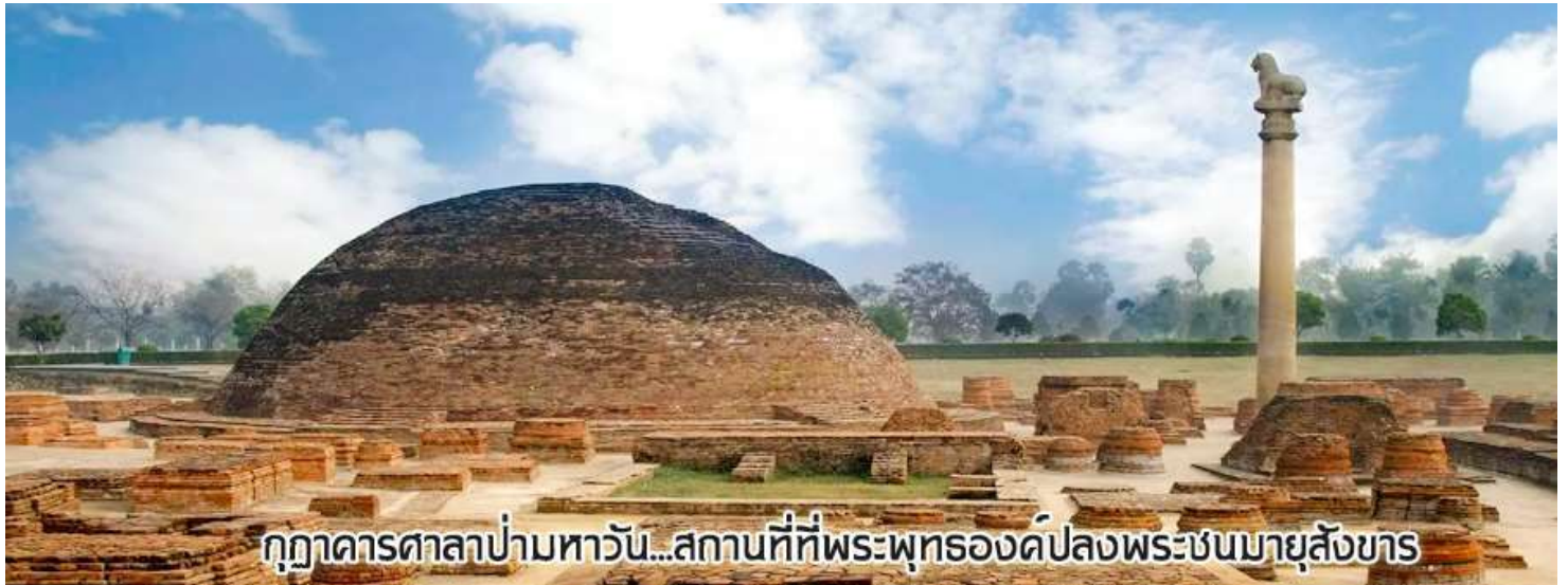
กุฎาคารศาลาป่ามหารวัน...สถานที่ที่พระพุทธองค์ปลงพระชนมายุสังขาร

นำท่านเดินทางต่อสู่เมือง กุสินารา (เดินทางประมาณ 4 ชั่วโมง)เมื่อถึงกุสินาราแล้วเดินทางไป วัดไทยกุสินาราเฉลิมราชย์ วัดนี้สร้างขึ้นเพื่อน้อมเป็นพุทธบูชาและเฉลิมพระเกียรติพระบาทสมเด็จพระเจ้าอยู่หัวในวาระครองสิริราชสมบัติครบ 50 ปี และเฉลิมพระชนมพรรษาครบ 6 รอบ 72 พรรษา พระบาทสมเด็จพระเจ้าอยู่หัวพระราชทานชื่อวัดให้ เชิญท่านร่วมทำบุญตามกำลังศรัทธา