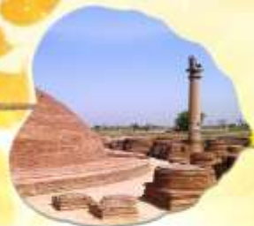
เมืองหลวงแคว้นอานาจักรวัชชี แคว้นชมพูทวีป