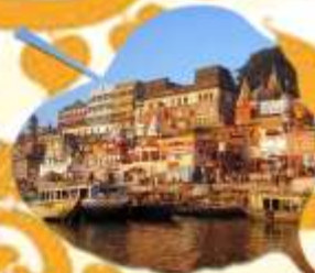
พาราณสี เมืองหลวงทางจิตวิญญาณทางอินเดีย