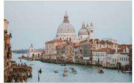
แกรนด์คาแนล

นำทุกท่านนั่งเรือต่อเพื่อไปยัง ท่าเรือซานมาร์โก (San Marco Pier) บนเกาะเวนิส แวะให้ท่านถ่ายรูปสวยๆ เก็บเป็นที่ระลึกกันที่ พระราชวังดอดจ์ พระราชวังริมน้ำแสนอลังการ ที่สร้างตั้งแต่ศตวรรษที่ 14 ในสไตล์เวเนเซียนโกธิค ที่เคยเป็นที่ประทับของผู้ปกครองของเวนิส แต่ตั้งแต่ปี 1923 ก็ได้เปลี่ยนเป็นพิพิธภัณฑสถานให้คนทั่วไปได้เข้าชม เป็นหนึ่งในแลนด์มาร์คหลักของเวนิส จากนั้นเดินเที่ยวชมแลนด์มาร์คสำคัญต่างๆ ในเมือง จัตุรัสเซนต์มาร์ค เป็นจัตุรัสหลักของเมืองเวนิส และยังเป็นศูนย์กลางเมืองตั้งแต่โบราณ จากนั้นนำท่านถ่ายรูปกับ มหาวิหารเซนต์มาร์ค มหาวิหารใหญ่ ของศาสนาคริสต์นิกายโรมันคาทอลิก อลังการด้วยการตกแต่งด้วยโดมใหญ่ และที่อยู่ติดกันและโดดเด่นด้วยความสูงถึง 50 เมตรก็คือ หอรบั้ง ถือเป็นหนึ่งในสัญลักษณ์ของเมืองที่ เห็นได้ไม่ว่าจะอยู่มุมไหนของเมืองก็ตาม และที่พลาดไม่ได้เลยก็คือ สะพานกอนหายใจ สะพานอันโด่งดังแห่งนี้ตั้งอยู่เหนือแม่น้ำที่คั่นกลางระหว่างคุกเก่ากับพระราชวังดอดจ์