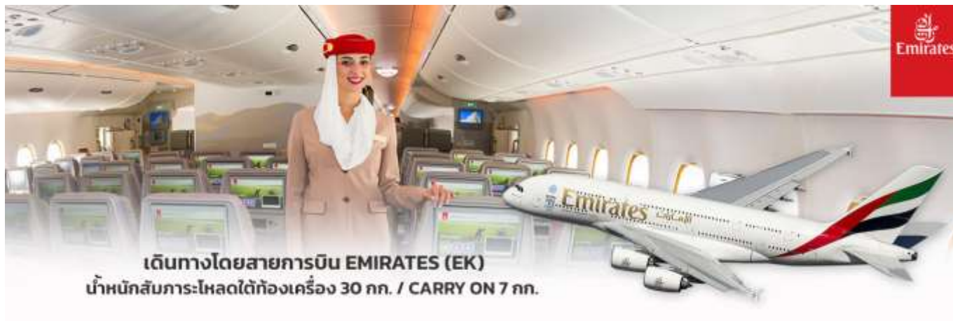
เดินทางโดยสายการบิน EMIRATES (EK) นำหนักสัมภาระโหลดใต้ท้องเครื่อง 30 กก. / CARRY ON 7 กก.