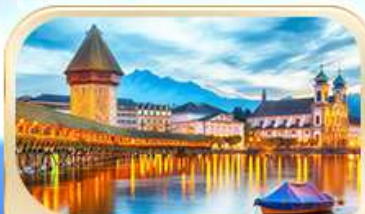
สะพานไมซ์ฮาเปล