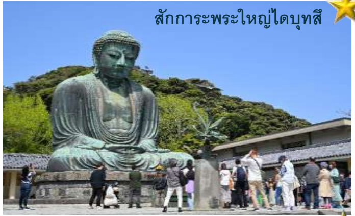
สักการะพระใหญ่ไดบุทสึ