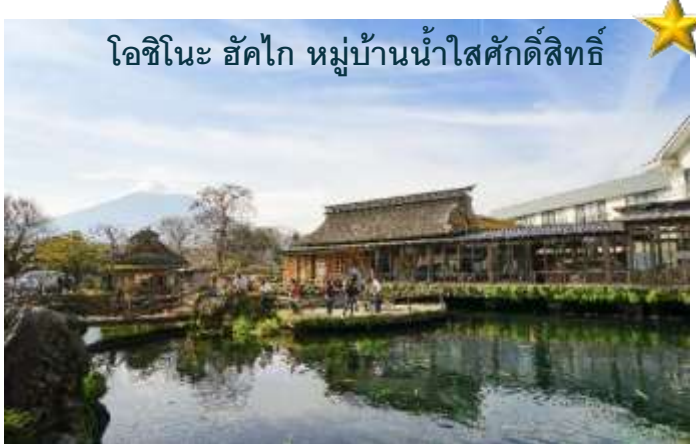
โอชิโนะ ฮัคไก หมู่บ้านน้ำใสศักดิ์สิทธิ์