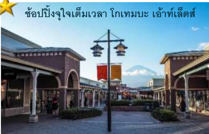
ช้อปปิ้งจุใจเต็มเวลา โกเทมบะ เอ้าท์เล็ตส์