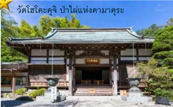
วัดโฮโคะคุจิ ป่าไม้แห่งคามาคูระ