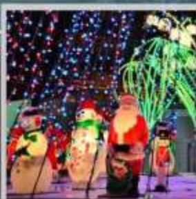
"ODORI GERMAN CHRISTMAS"