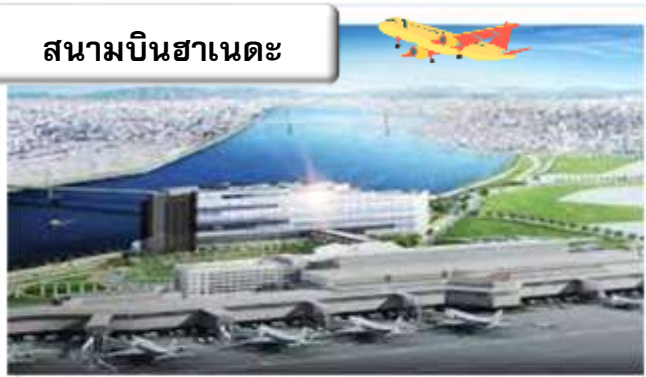
สนามบินฮานอย

22.45 น. ออกเดินทางสู่ สนามบินฮานอย ประเทศญี่ปุ่น โดย สายการบินไทย เที่ยวบินที่ TG 644