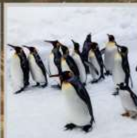
"PENGUIN ASAHİYAMA ZOO"