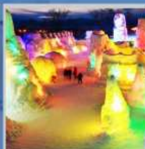
"SHIKOTSU ICE FEST"