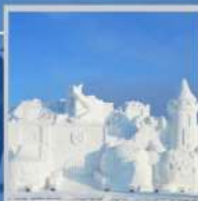
"ASAHIKAWA SNOW FEST"