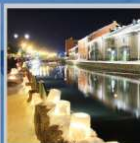
"OTARU CANAL FEST"