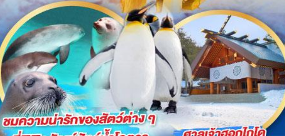
ชมความน่ารักของสัตว์ต่างๆ ที่พิพิธภัณฑ์สัตว์น้ำโอตารุ