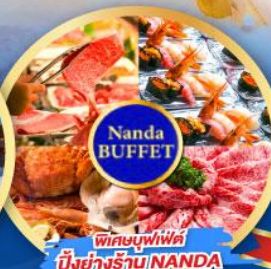
พิเศษบุฟเฟ่ต์ บึงย่างร้าน NANDA