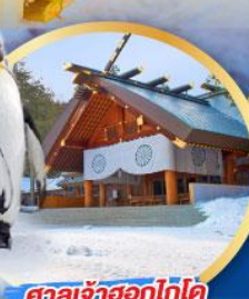
ศาลเจ้าฮอกไกโด