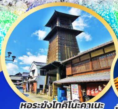
หอรบั้งโทคิโนะคาเนะ