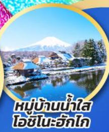
หมู่บ้านน้ำใส โอชิโนะฮักไก