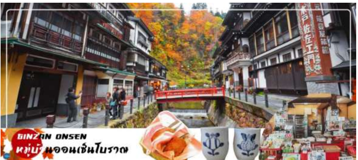
GINZAN ONSEN หมู่บ้านออนเซ็นโบราณ

เช้า รับประทานอาหารเช้า ณ ห้องอาหารของโรงแรม (2) นำท่านชมความงามแปลกตาของฤดูใบไม้เปลี่ยนสี ณ ภูเขาไฟซาโอะ (ZAO VOLCANO) (ใช้เวลาเดินทางประมาณ 1.30 ชั่วโมง) จุดชมใบไม้เปลี่ยนสีที่มีชื่อเสียงของภูมิภาคโทโฮคุ ตลอดเส้นทางท่านจะได้เพลิดเพลินกับธรรมชาติหลากหลายสีสันของป่าเขาในฤดูใบไม้ร่วง จากนั้นนำท่าน ขึ้นกระเช้าไฟฟ้า สูดอากาศให้ท่านได้ชมทัศนียภาพอันสวยงามของฤดูใบไม้เปลี่ยนสีไปยังยอดเขาที่ระดับความสูง 1,736 เมตร ด้านบนประดิษฐานพระพุทธรูปจิโซองค์ใหญ่ แกะสลักจากหินคาคดผ้าเอี่ยมสีแดงไว้ที่หน้าอกเพื่อเป็นการอุทิศให้กับทารกที่เสียชีวิตจากการทำแท้ง นอกจากนี้ยังมีทะเลสาบบริเวณปากปล่องภูเขาไฟซาโอะคือ ทะเลสาบโอกามะ หรือทะเลสาบห้าสี ซึ่งสีของน้ำจะเปลี่ยนไป