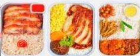
บริการอาหารร้อน ทั้งขาไป-ขากลับ