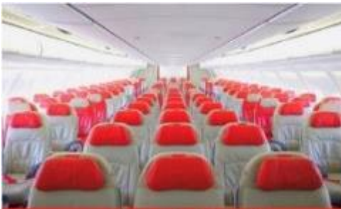
เครื่องบินใหญ่ 377 ที่นั่ง

จากนั้นนำท่านถ่ายรูปกับ “TOKYO SKYTREE” (ด้านนอก) ที่บริเวณสะพานข้ามแม่น้ำสุมิตะหนึ่งในแลนด์