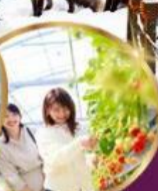
บุฟเฟต์ สดอเบอร์รี่ เก็บสดจากต้น

ราคา เดี่ยว 45,919 บาท รวมภาษีมูลค่าเพิ่ม 7%