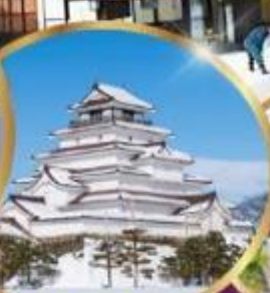
ปราสาท สึรุกะ