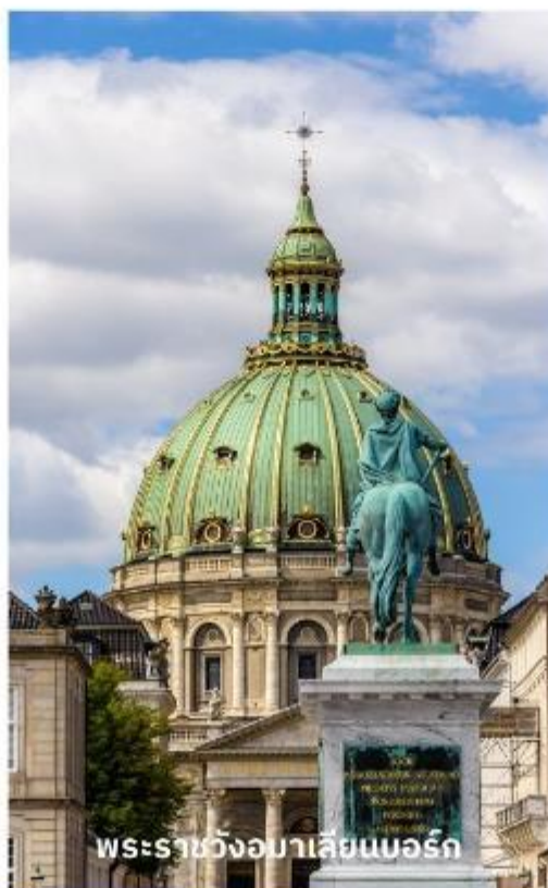
พระราชวังอมาเลียนบอร์ก