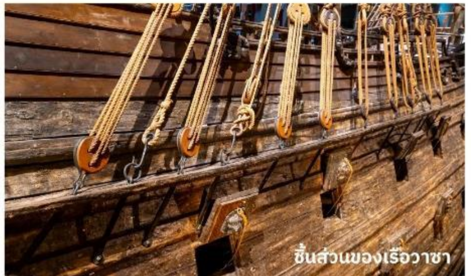
ชิ้นส่วนของเรือวาซา