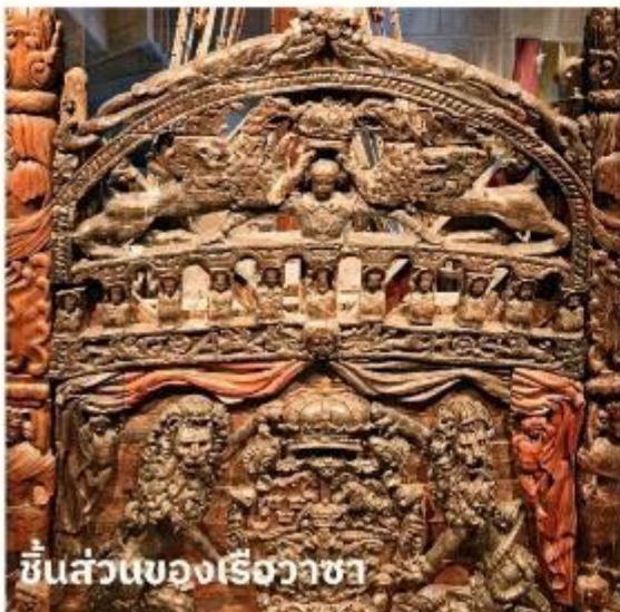
ชิ้นส่วนของเรือวาซา