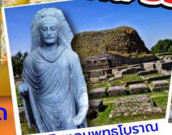
ดินแดนพุทธโบราณ ตักศิลา