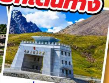
ด่านคุนจิราบ