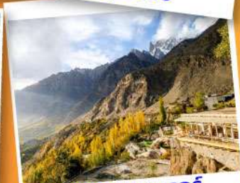
ยอดเขาตุยเกอร์