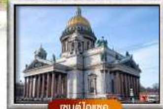
เซนต์โอสเตค