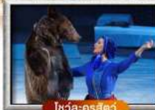
โซวโล-ครสค์