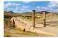
สะพานเซเวอรัม

19.20 น. เห็นฟ้าสูนครอิสตันบูล โดยเที่ยวบิน TK 2215