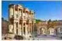
เมืองโบราณเอเฟซุส