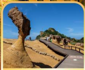
อุทยานหินเหย์หลิว