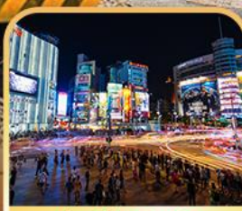
ย่านซีเหมินติง