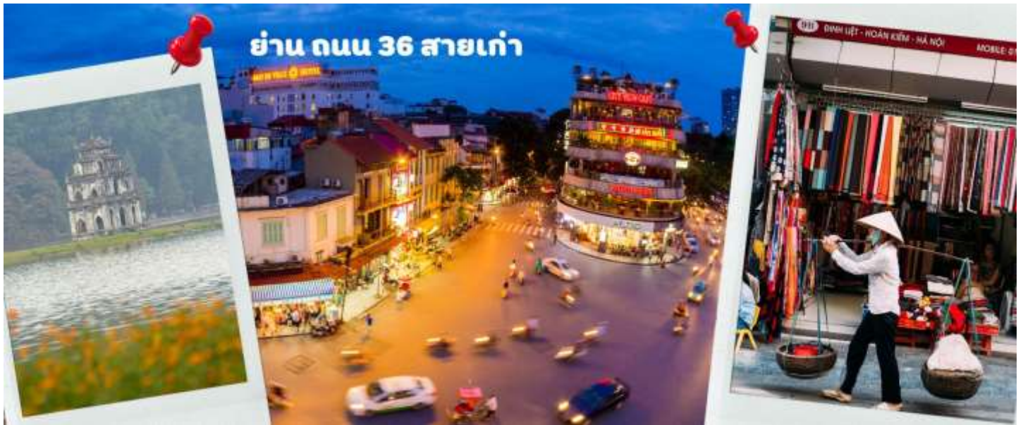
ย่าน ถนน 36 สายเก่า

จากนั้นให้ท่านได้ อิสระช้อปปิ้ง ถนนสาย 36 street แหล่งช้อปปิ้งของฮานอย มีต้นไม้ปกคลุมสองฝั่งถนน สาเหตุที่ชื่อถนน 36 มาจาก 36 อาชีพที่ทำการค้าขายบนถนนแห่งนี้ ตั้งแต่อดีตอย่างงานด้านหัตถกรรมสอดคล้องกับชื่อถนนแต่ปะเส้น ในอดีตอย่าง เครื่องเงิน ผ้าไหม บนถนนแห่งนี้ แต่ปัจจุบันมากกว่า 36 ไปแล้ว ที่นี่จะเป็นแหล่ง Shopping มีสินค้าเกือบทุกชนิด ร้านขายชุดกีฬาที่มีทุกแบรนด์เพราะที่นี่เป็นแหล่งผลิตให้หลาย ๆ แบรนด์