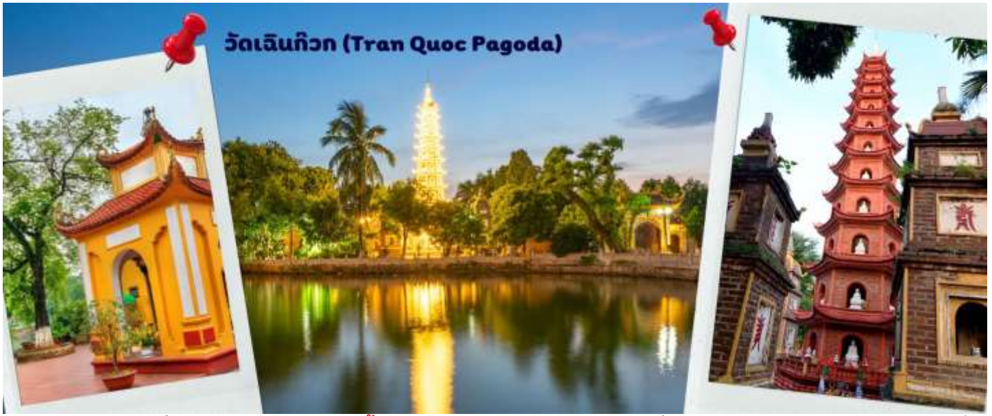
วัดเลนทีกว (Tran Quoc Pagoda)

จากนั้นให้ท่านได้ อิสระช้อปปิ้ง ถนนสาย 36 street แหล่งช้อปปิ้งของฮานอย มีต้นไม้ปกคลุมสองฝั่งถนน สาเหตุที่ชื่อถนน 36 มาจาก 36 อาชีพที่ทำการค้าขายบนถนนแห่งนี้ ตั้งแต่อดีตอย่างงานด้านหัตถกรรมสอดคล้องกับชื่อถนนแต่ปะเส้น ในอดีตอย่าง เครื่องเงิน ผ้าไหม บนถนนแห่งนี้ แต่ปัจจุบันมากกว่า 36 ไปแล้ว ที่นี่จะเป็นแหล่ง Shopping มีสินค้าเกือบทุกชนิด ร้านขายชุดกีฬาที่มีทุกแบรนด์เพราะที่นี่เป็นแหล่งผลิตให้หลาย ๆ แบรนด์