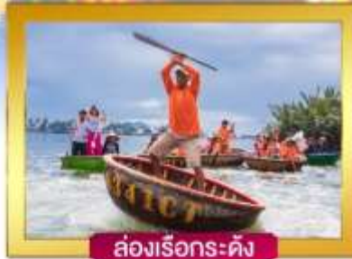
ล่องเรือกระดังง์