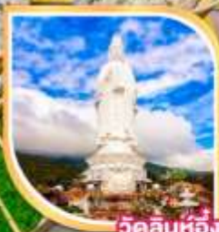
วัดลินห์ฮ้อย