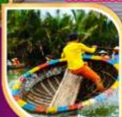
ล่องเรือกระด้ง