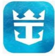
Royal Caribbean International App.